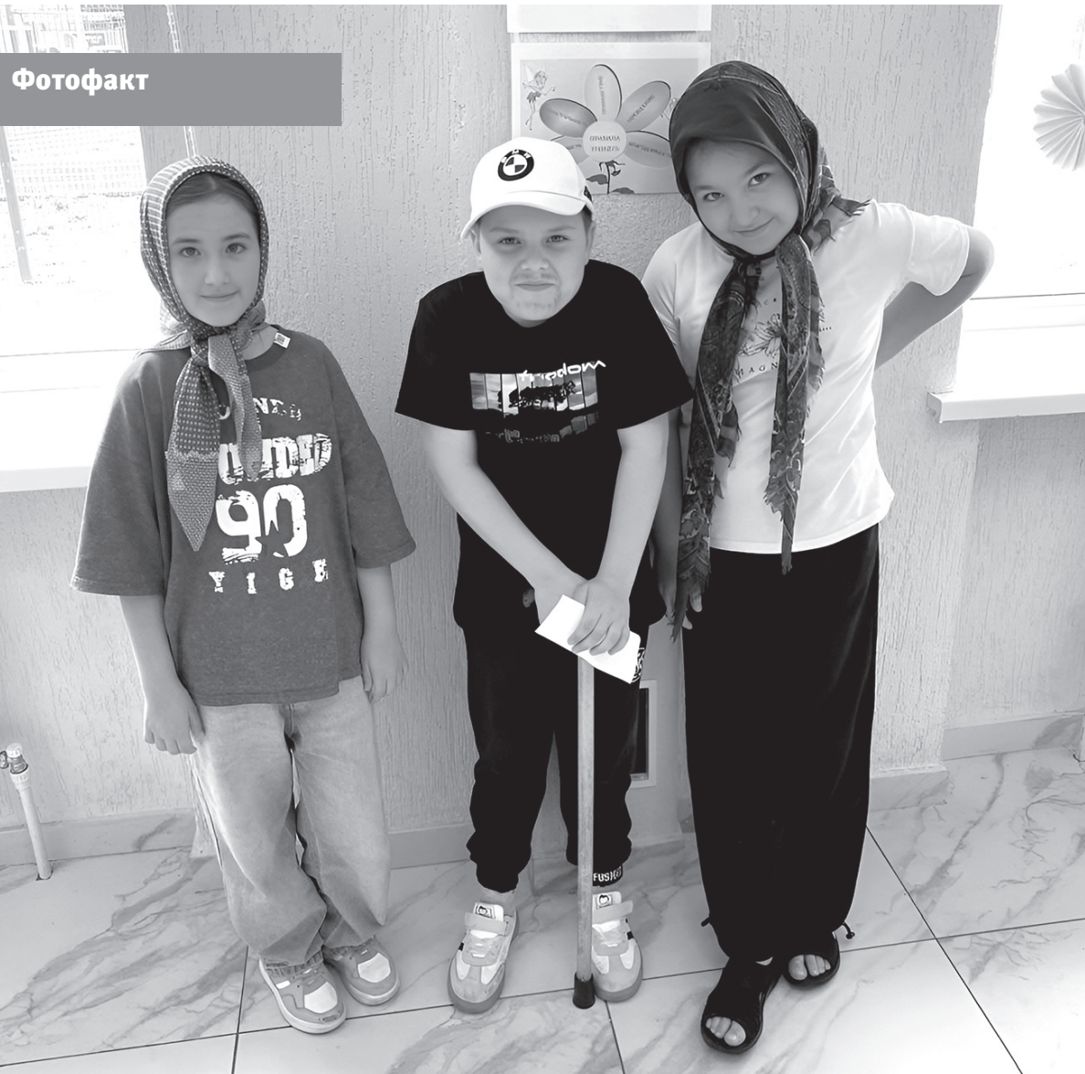
Второго июня в СОШ № 6 Черкесска состоялось торжественное открытие летнего школьного лагеря «Капитошка». Вожатые и воспитатели приложили массу усилий, чтобы первый день запомнился детям как яркий и добрый праздник. Для ребят организовали целое представление, в котором они сами стали участниками. Уже прошли первые мастер-классы и творческие занятия. Например, 3 июня в лагере был День этикета. И это был не просто урок вежливости, а настоящее путешествие в мир культуры и хороших манер!