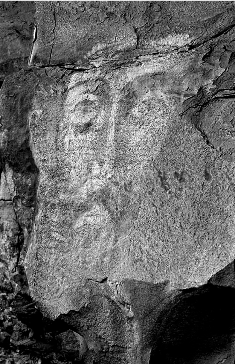
Лик Христа в Архызе

— Он — тот, кто открыл для меня Небо, тот, под рукой и кистью которого оживают мертвые стены, кто своими чудесными красками превращает сырую холодную осень в теплое и благодатное лето, тот, с которым Бог стал близким и