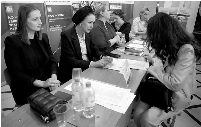
Ярмарки вакансий предоставляют широкий круг возможностей

На площадке индустриально-технологического колледжа состоится Фестиваль профессий — основное профориентационное мероприя-